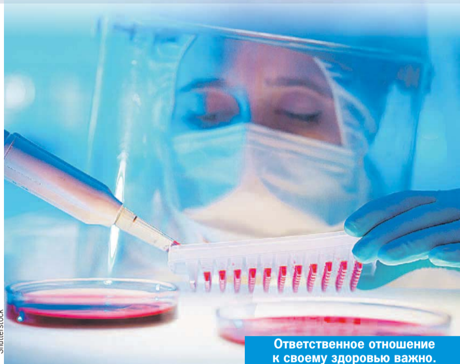
Ответственное отношение к своему здоровью важно.

«Так же как населению в целом следует настойчиво объяснять, что ответственное отношение к своему здоровью - признак, или, как принято говорить, must do, современного успешного человека, так и инфицированному ВИЧ человеку необходимо