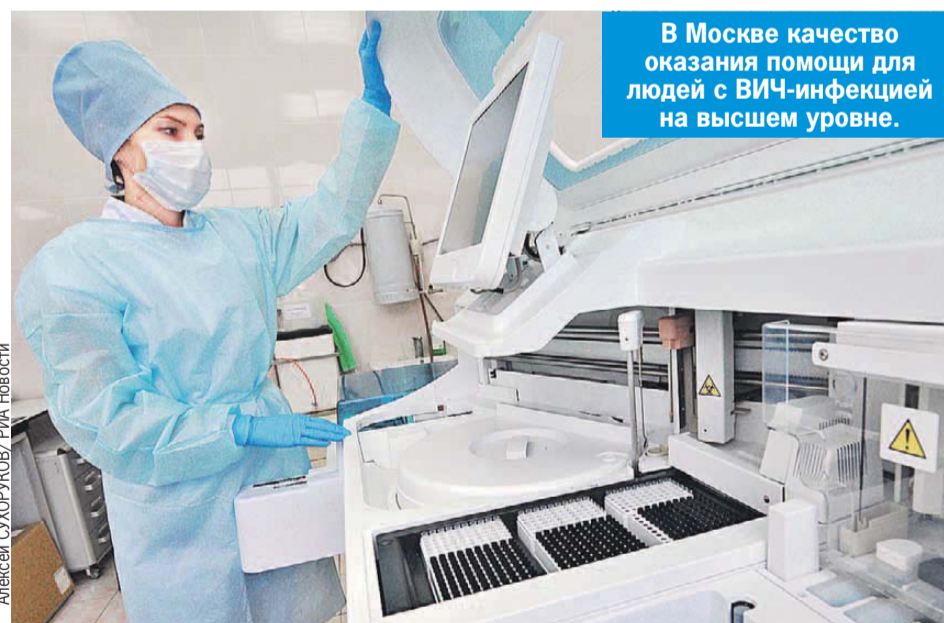
В Москве качество оказания помощи для людей с ВИЧ-инфекцией на высшем уровне.

По его словам, почти все ВИЧ-инфицированные дети в городе воспитываются в семьях, и это убедительный показатель того, насколько изменилось восприятие людей с ВИЧ-инфекцией москвичами.